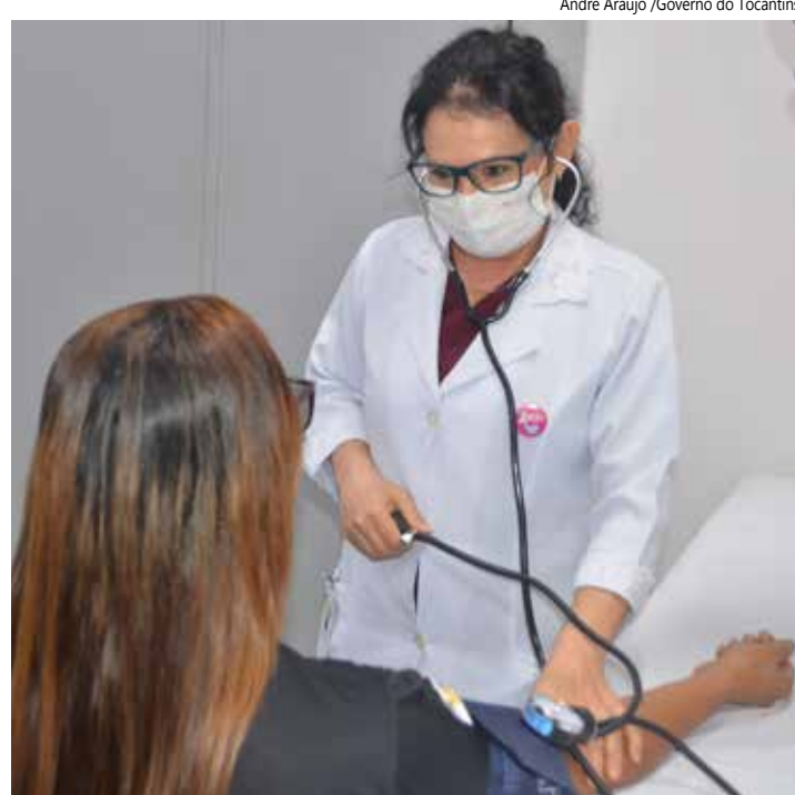
A medida vale para as unidades geridas pela SES-TO.

A MP busca garantir a cobertura de serviços essenciais à assistência hospitalar dos pacientes que ingressarem nas unidades hospitalares e unidades da Hemorrede, ambas de assistência especializada de média e alta complexidade, com intervenções no processo do cuidado, visando o tratamento e o restabelecimento das condições de saúde do paciente, realizando aten-