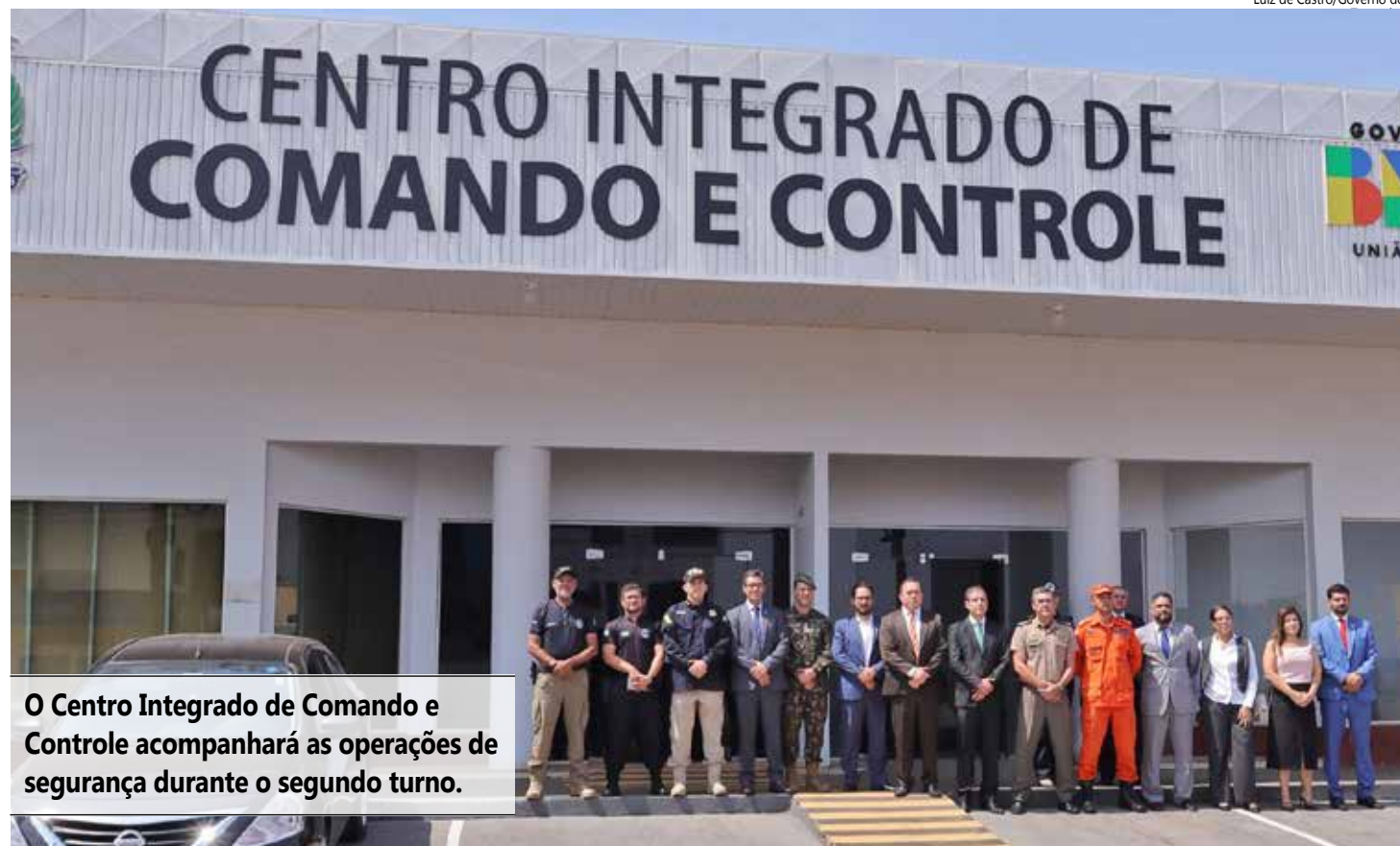
O Centro Integrado de Comando e Controle acompanhará as operações de segurança durante o segundo turno.

ção é coordenada pelo Centro Integrado de Comando e Controle da SSP (CICCE), em apoio ao Tribunal Regional Eleitoral do Tocantins (TRE/TO). As ações contam com a participação das Polícias Civil (PC), Militar (PMTO) e Penal; do Corpo de Bombeiros Militar do Tocantins (CBMTO), do 22º Batalhão de Infantaria do Exército Brasileiro, além da Polícia Federal (PF), Polícia Rodoviária Federal (PRF), da Secretaria