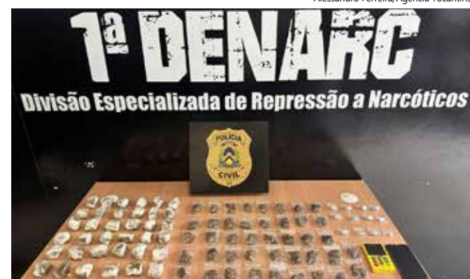
Foi encontrada uma bolsa com maconha, skank e 'ice'.