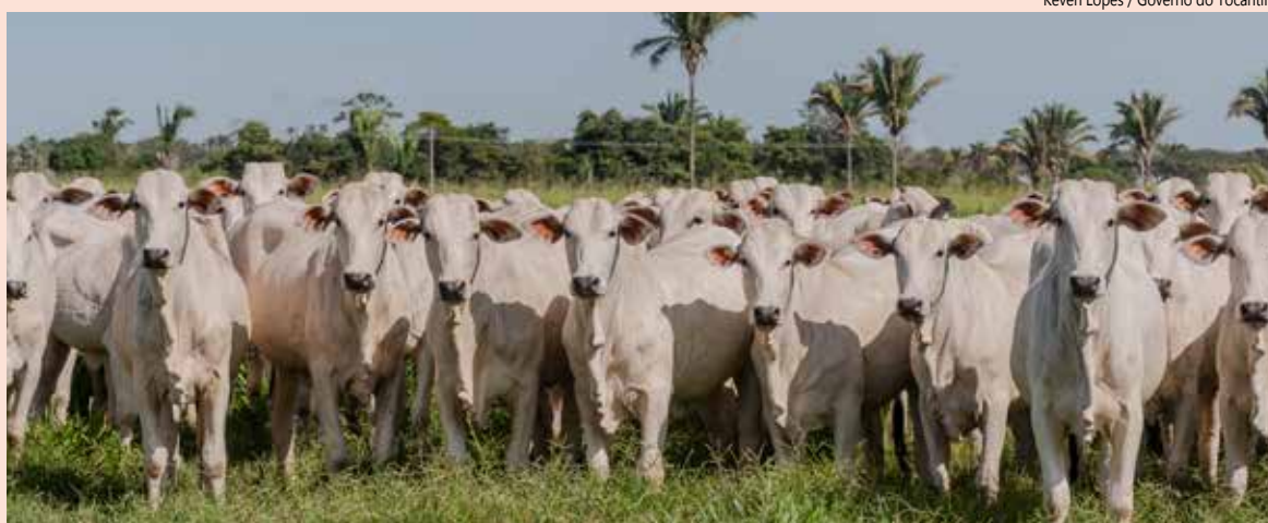
O estado do Tocantins possui mais de 12 milhões de animais.

O Governo do Tocantins, por meio da Agência de Defesa Agropecuária (Adapec), inicia a partir do dia 1º de novembro, e segue até o dia 30, a segunda etapa da Campanha de Declaração de Informações Pecuárias obrigatória para todos os animais das propriedades rurais. O Tocantins conta atualmente com mais de 58 mil propriedades cadastradas na Adapec e mais de 12 milhões de animais.