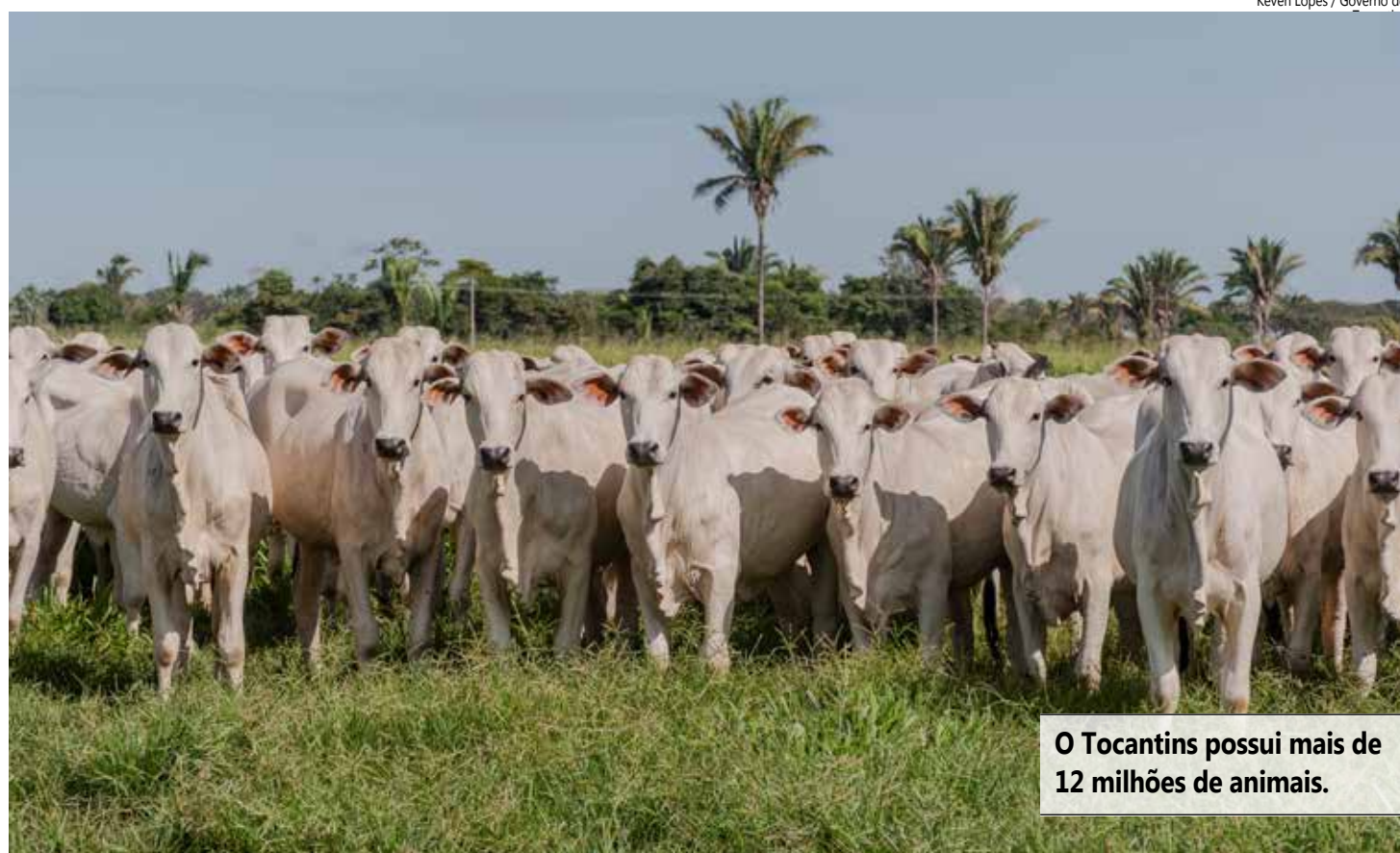
O Tocantins possui mais de 12 milhões de animais.