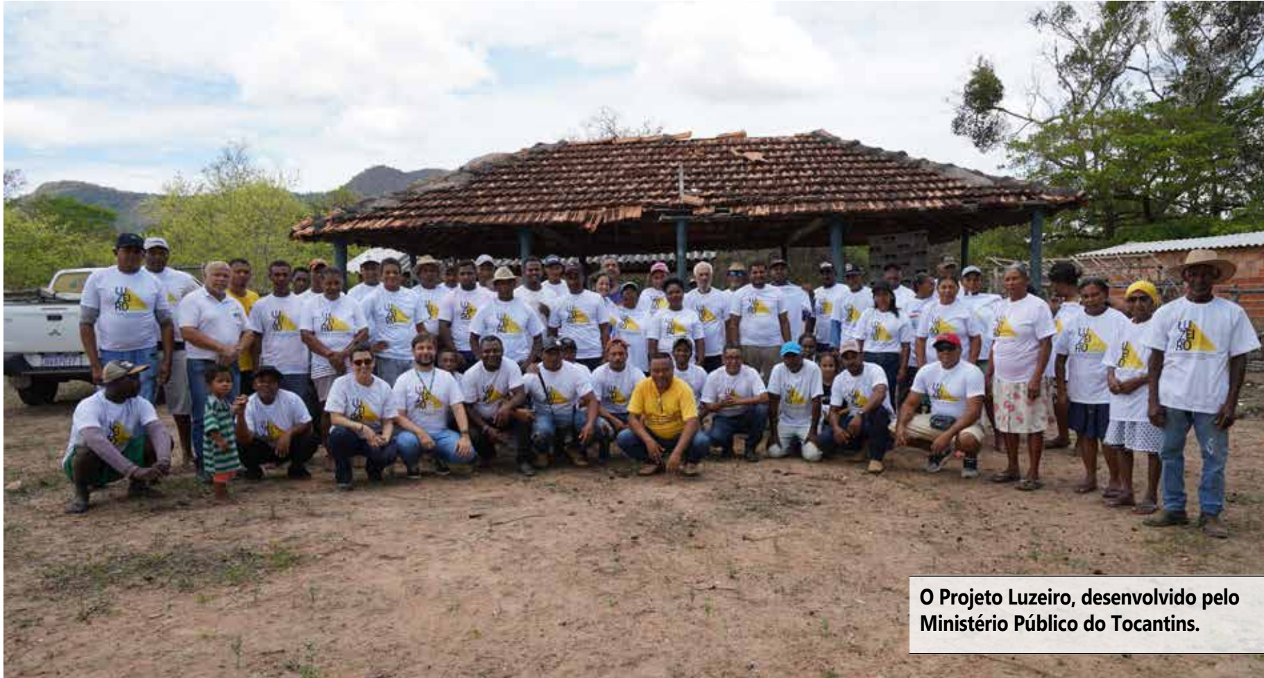
O Projeto Luzeiro, desenvolvido pelo Ministério Público do Tocantins.

Cursos e oficinas sobre temas como associativismo, cooperativismo e liderança comunitária, além da valorização da cultura local e do intercâmbio com instituições culturais, foram apontados como essenciais