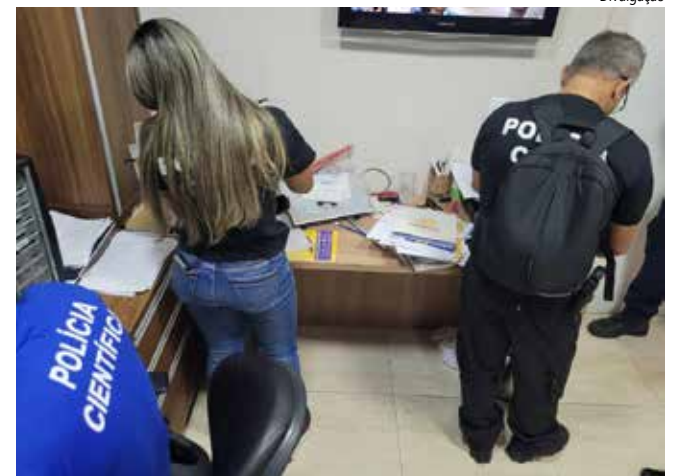
Foram cumpridos 18 mandados de busca e apreensão.