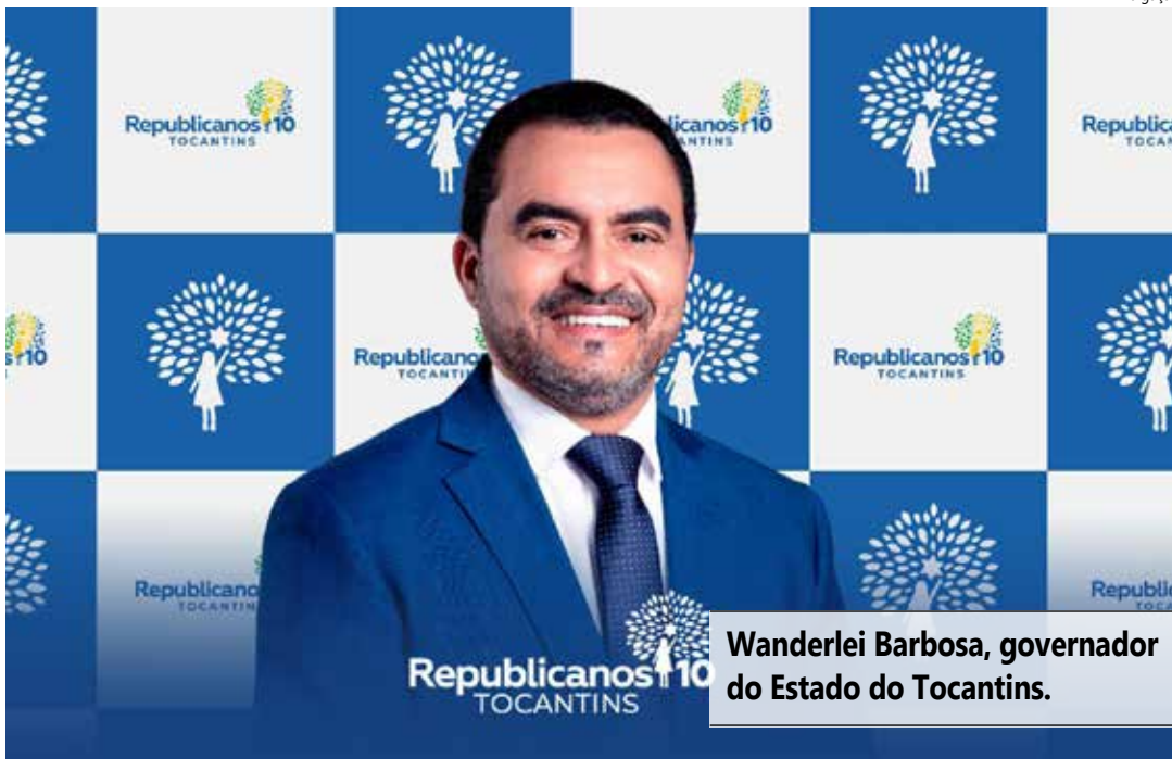
Wanderlei Barbosa, governador do Estado do Tocantins.

Em relação ao desempenho do partido por estado Wanderlei Barbosa elegeu 12,7% de todos os prefeitos do Republicanos no Brasil,