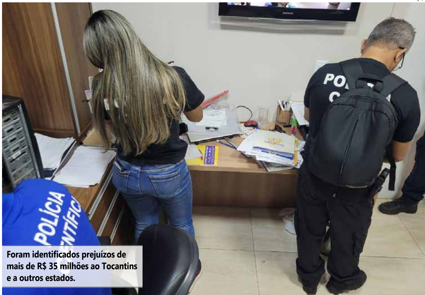
Foram identificados prejuízos de mais de R$ 35 milhões ao Tocantins e a outros estados.

A decisão da 3ª Vara Criminal da Capital autorizou a realização de buscas em diversos endereços, bem como a quebra