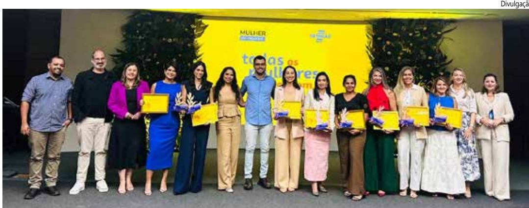
O Prêmio Sebrae Mulher de Negócios é dividido em três etapas: estadual, regional e nacional.