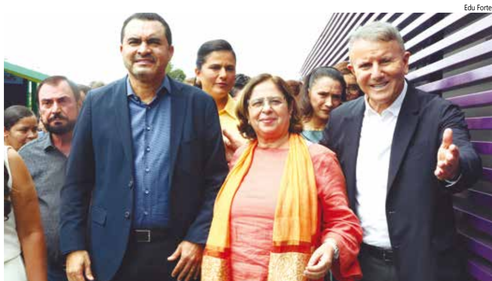
Governador Wanderlei Barbosa, Ministra Cida Gonçalves e Prefeito Eduardo Siqueira.

"A Casa tem um conselho gestor, com participação do governo estadual e municipal, que ajuda a resolver os principais casos e problemas, e trabalhar para encontrar