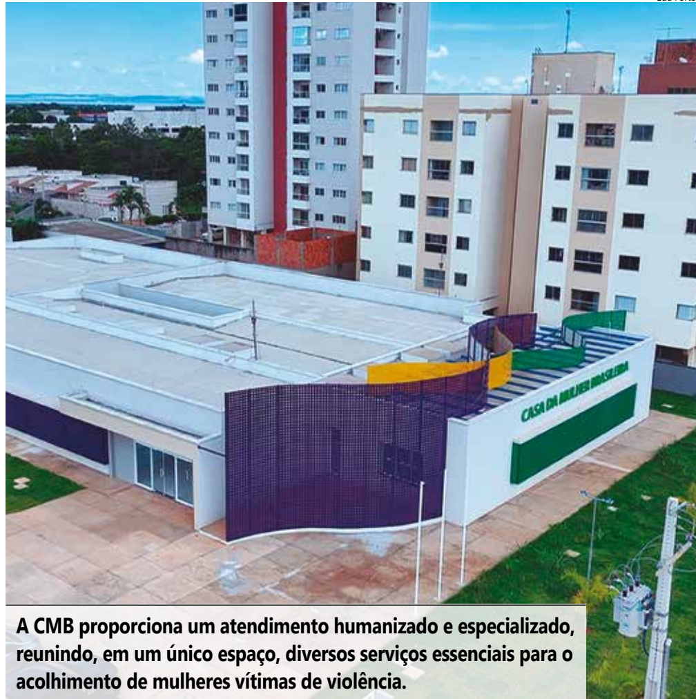
A CMB proporciona um atendimento humanizado e especializado, reunindo, em um único espaço, diversos serviços essenciais para o acolhimento de mulheres vítimas de violência.

Dentre os serviços oferecidos, estão acolhimento e triagem, apoio psicossocial, delegacia, Juizado, Ministério Público, Defensoria Pública, promoção da autonomia econômica, brinquedoteca para o cuidado das