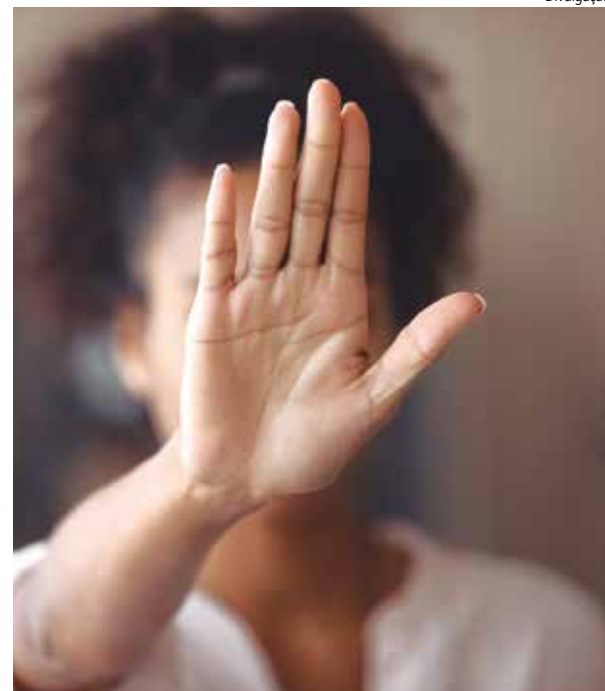
A maioria das vítimas são negras e pardas.