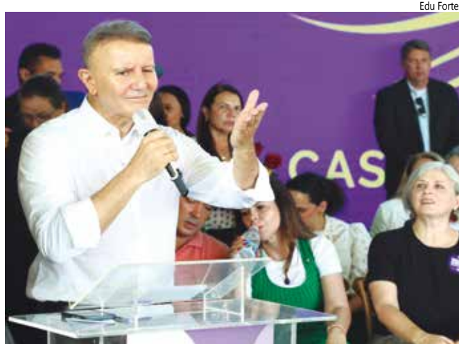
O prefeito de Palmas, Eduardo Siqueira Campos.

cipal na implementação desse equipamento. "A presença do governo do estado neste projeto, em parceria com o município e liderado pelo governo federal, é fundamental para nós", declarou.